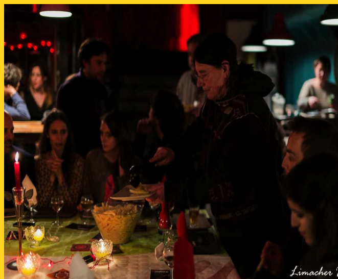
Ondine – Cie Underground Sugar dans le cadre des Jeudis du Clapier le rendez-vous des acteurs-spectateurs curieux qui après le spectacle dînent tous ensemble