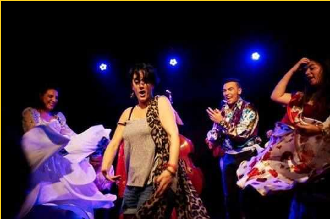
Le bal Tsigane public et musiciens sont invités à danser ensemble...