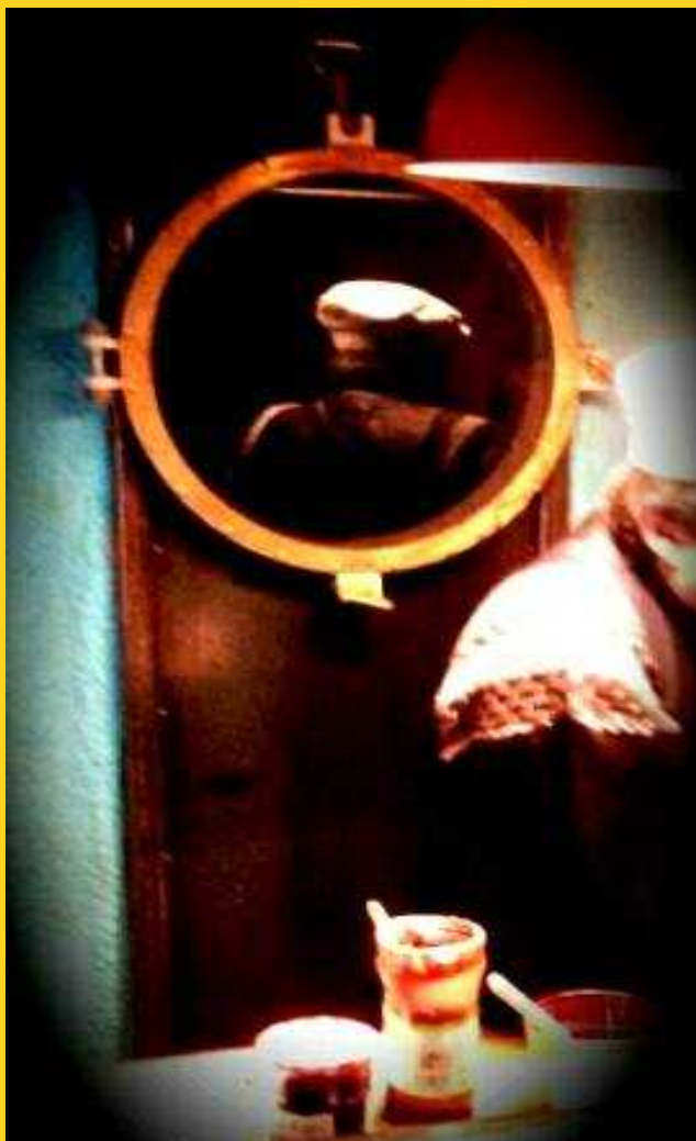
Nourritures terrestres élaborées par le cuisinier du jour !