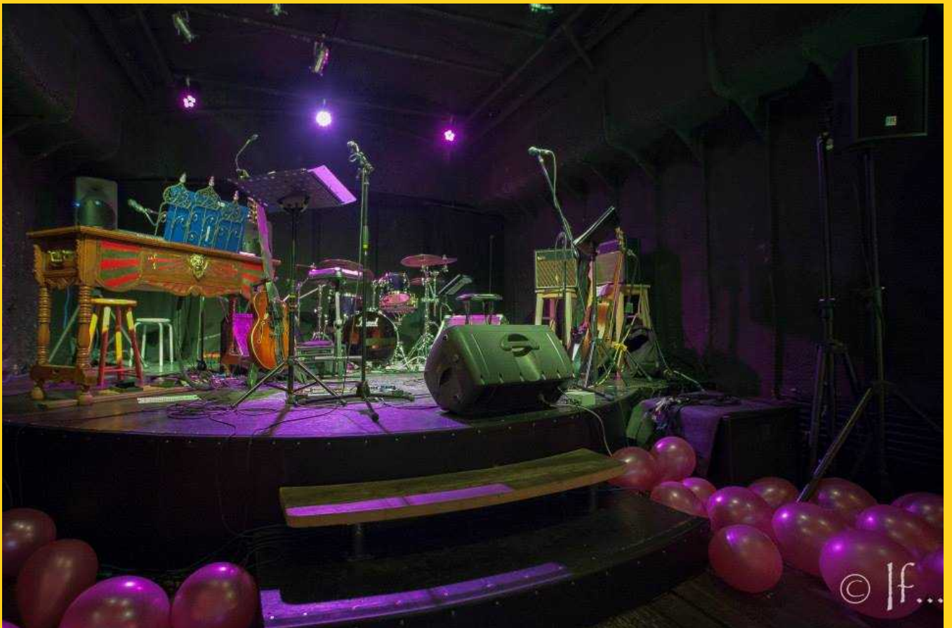
Concert Nemo C Nemo