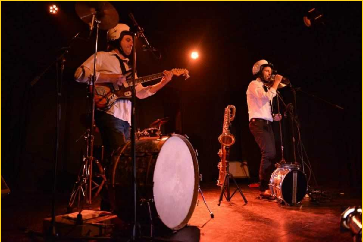
Concert We Shot