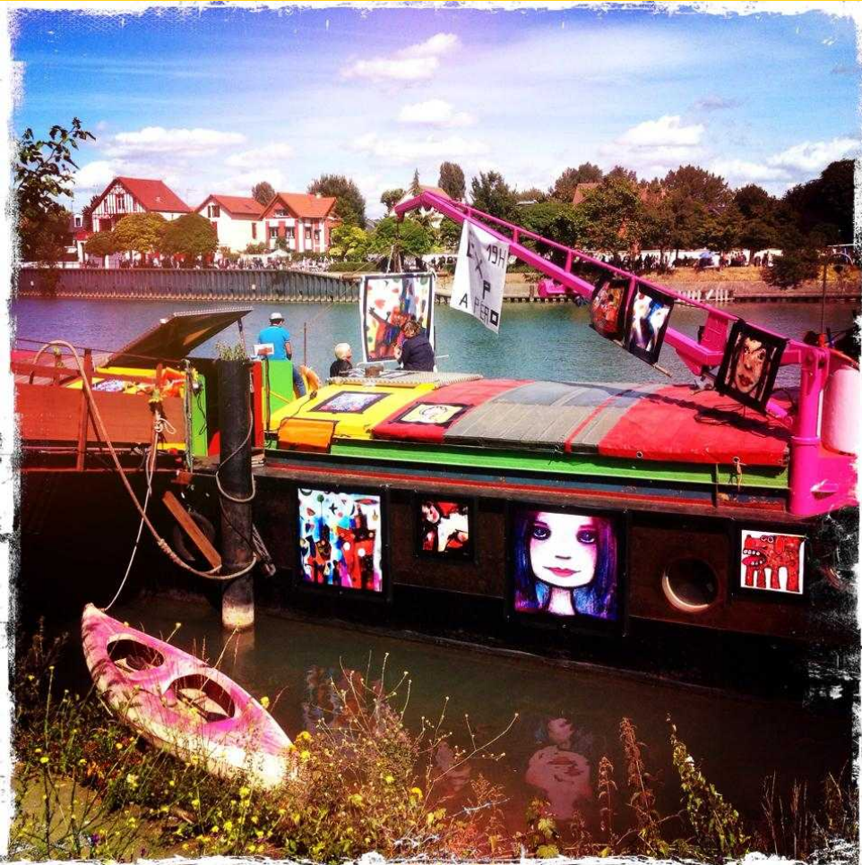
exposition de l'artiste peintre Kats