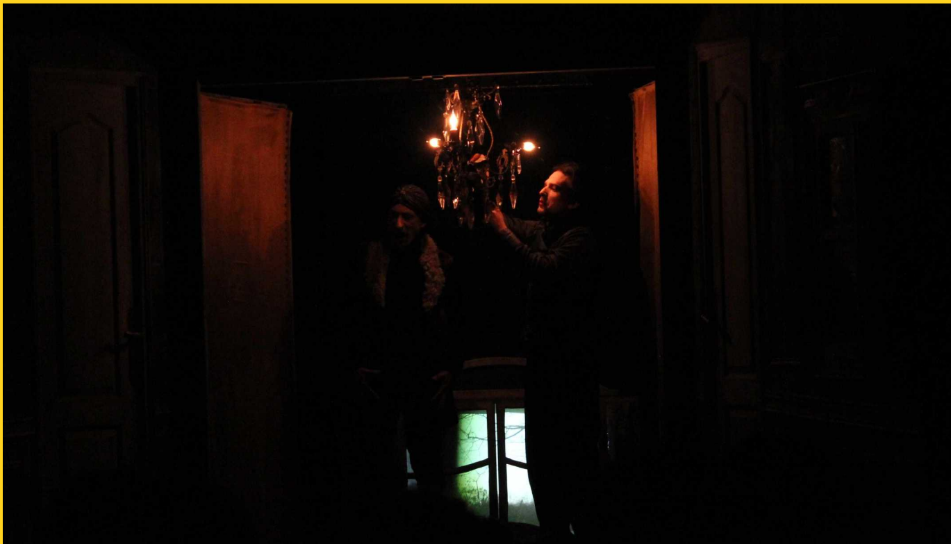
L'Avare – Molière Cie la Drôlesse